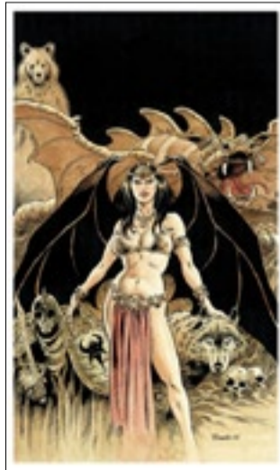
Tiré à part de Yves Swolfs

Des sérigraphies ont également été imprimées, notamment une scène de chasse en noir et blanc par Denis Bodart (Green Manor), et une grande sérigraphie couleurs (45x65cm, 7 passages) de Frank Pé !