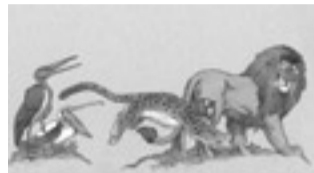
Détail d'une des images